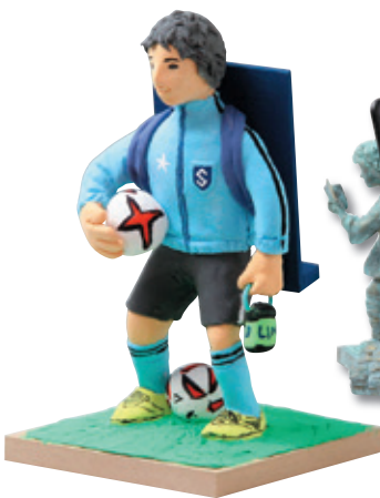
のび〜るエアクレイLL使用例