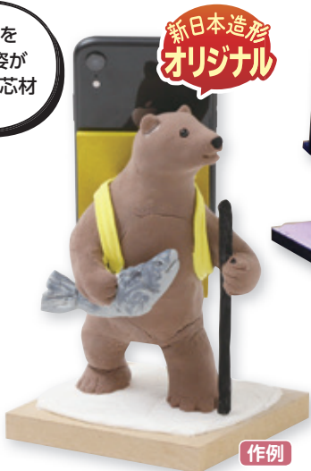
めちやのびねんど2個使用例