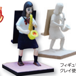
フィギュモ クレイ使用例