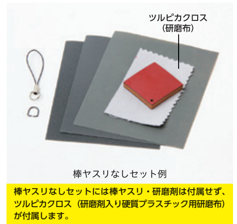
棒ヤスリなしセット例

堆朱板 (約35×35×6mm) 1組・取り付け金具・耐水ペーパー (#240、#400、#800)・ツルピカクロス (研磨布) 付