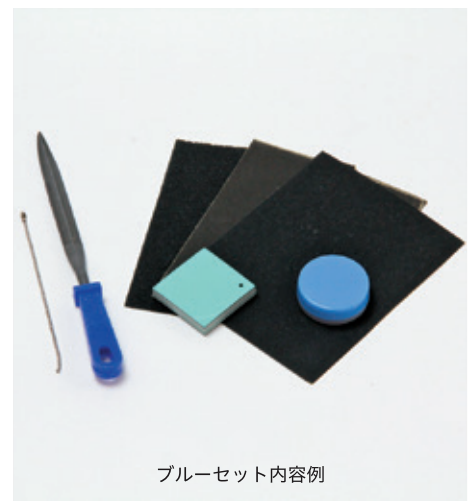
ブルーセット内容例

堆朱板 (約35×35×6mm) 1枚、ボールチェーン・工芸ヤスリ甲丸・耐水ペーパー (#240、#400、#800)・研磨剤付