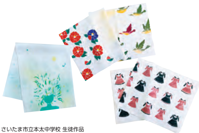
さいたま市立本太中学校 生徒作品