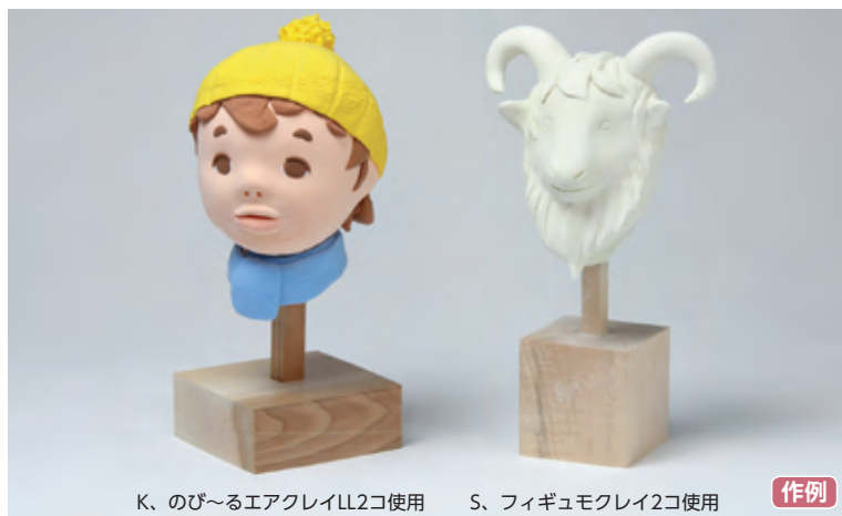
K、のび〜るエアクレイLL2コ使用 S、フィギュモクレイ2コ使用