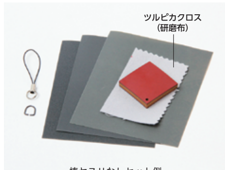
棒ヤスリなしセット例

堆朱板 (約35×35×6mm) 1組、取り付け金具・耐水ペーパー・ツルピカクロス (研磨布) 付