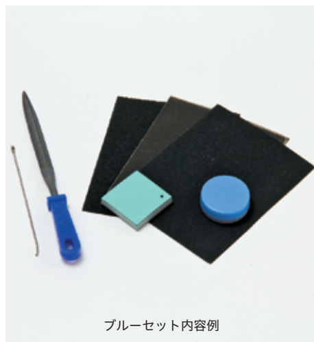
ブルーセット内容例

堆朱板 (約35×35×6mm) 1枚、ボールチェーン・工芸ヤスリ甲丸・耐水ペーパー・研磨剤付