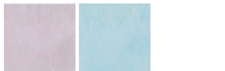
もも みずいろ 色見本