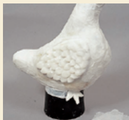
③木工用接着剤を3倍にうすめて雲竜紙に塗り、原型に貼り付けます。