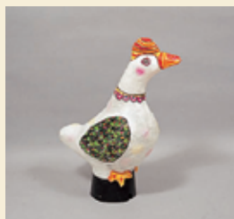
⑤水彩・マーカーなどで着色します。