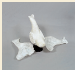
④和紙が乾燥してからはがします。形状によってはカッターで割り、後で接着します。