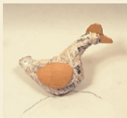
①紙・木等でベースとなる芯材をつくります。