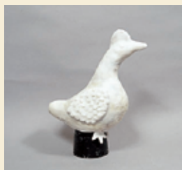
②芯材の上に粘土をつけて形をととのえ、上から離型用シールを貼ります。