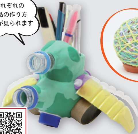
ペットボトル使用 ペン立て作例