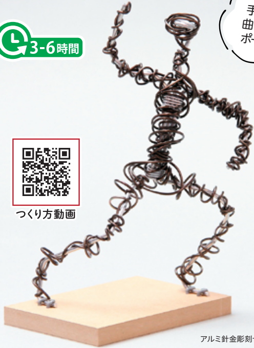
アルミ針金彫刻セット使用