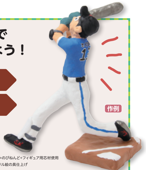
めちやのびねんど+フィギュア用芯材使用 アクリル絵の具仕上げ